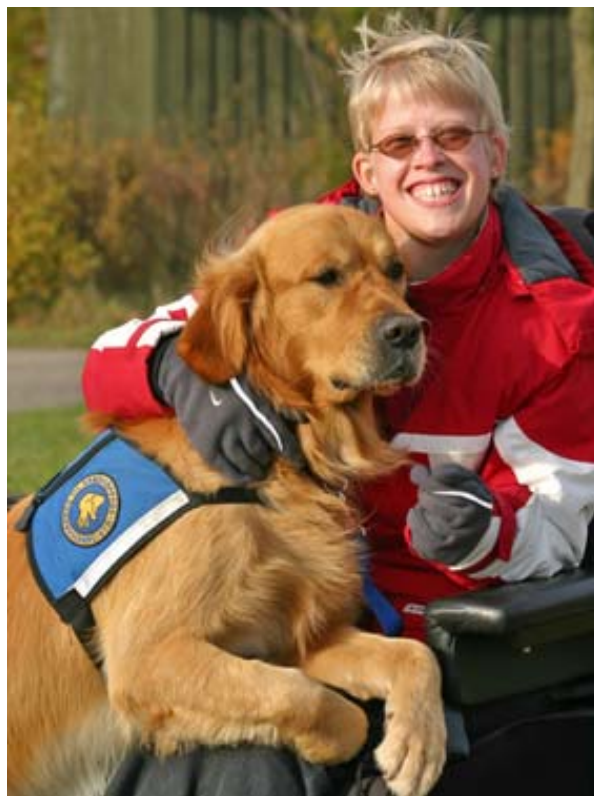
Frigg og Targo

Hundene Targo og Lolle blev officielt overrakt brugerne – en ung pige med muskelsvind og en der er spastisk lammet – ved en festlig lejlighed på Amtsgården i Odense i april måned.