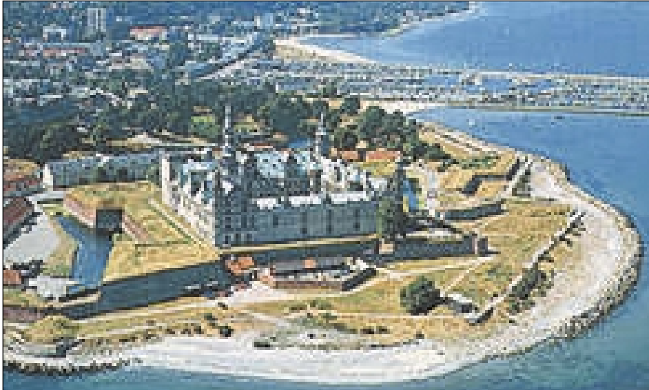
Hamlets by, Helsingør.