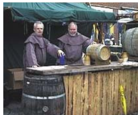
Dette initiativ i LC Horsens skal nok hæve mødeprocenten til klubmøderne...