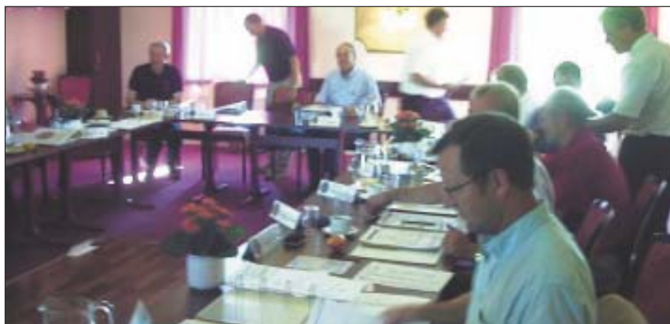
Distriktsrådet gør klar til årets første møde.

Indlæg sendes til PRC på mail: jepppe@jeppereklame-vejen.dk