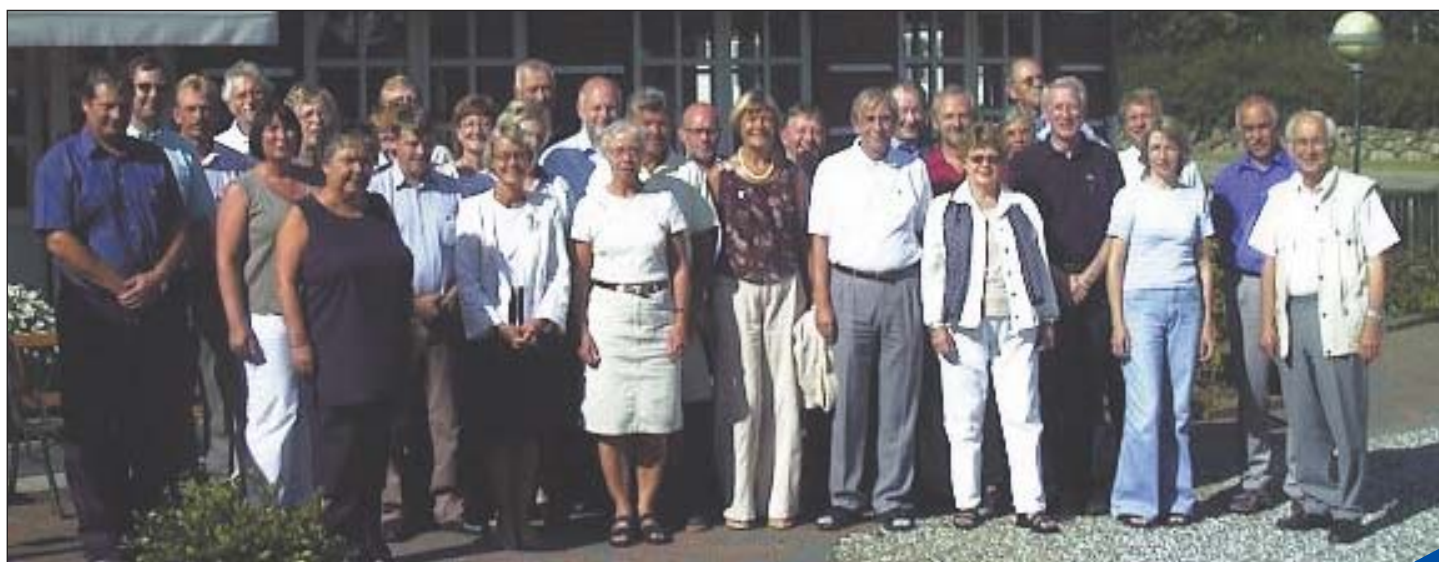
Distriktsrådet 2004/2005 med ledsagere samlet til det første »rådsmøde«...